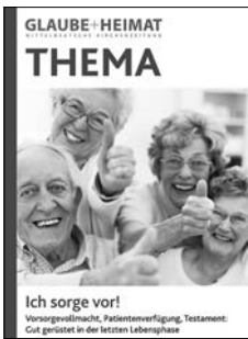
THEMA Ich Sorge vor! Vorsorgevollmacht, Patientenverfügung, Testament: Gut gerüstet in der letzten Lebensphase

1 € für bis zu 8 Hefte 4 € für bis zu 17 Hefte 6 € für 18 bis 99 Hefte