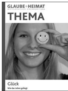
THEMA Glück Wie das Leben gelingt