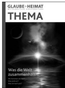
THEMA Was die Welt zusammenhält Wo kommen wir her? Was sind wir? Was ist nach uns?