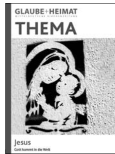
THEMA Jesus Gott kommt in die Welt