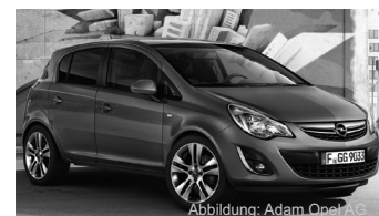
Abbildung: Adam Opel AG

z.B. Opel Corsa 1.2 ecoFLEX, 5 türig, mit 51 kW (70 PS)